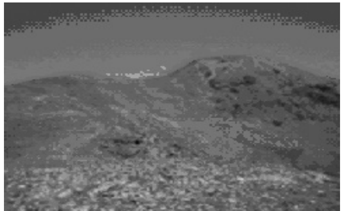
Falda del Puigmal des de Fontalba

La propera sortida serà el dia 13 de Juny al Ripollès - BASTIMENTS (2.882 m)